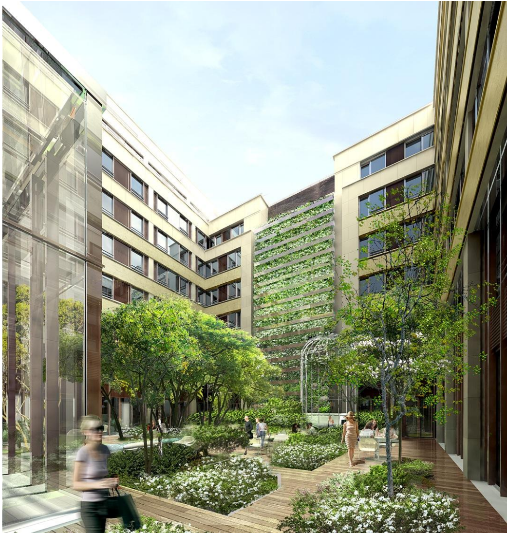
Patio de l'hôtel Mandarin Oriental Paris (vue d'artiste)

La SFL, avec un patrimoine exceptionnel de plus de 3,1 milliards d'euros droits inclus centré sur le Quartier Central des Affaires de Paris, constitue le vecteur privilégié d'accès au marché immobilier de bureaux et de commerces de la capitale. Le groupe, leader sur ce marché, se positionne aujourd'hui résolument vers la gestion dynamique d'actifs immobiliers de grande qualité. SFL a opté pour le régime des sociétés d'investissements immobiliers cotées (SIIC) en 2003.